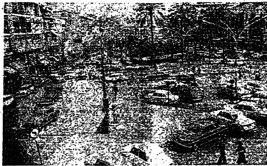
ساحة الشهداء كما بدت أمس... مظاهرات مقلدة وحركة سير جزئية وعدد من المواطنين الذين نزلوا الى الاسواق أمس